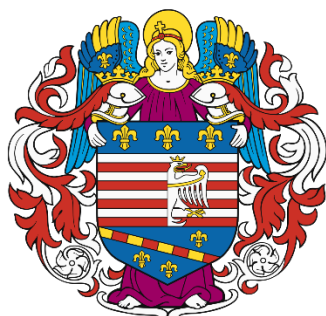
Grb mesta Košice

Mesto je znano kot prvo naselje v Evropi, ki je dobilo svoj grb.