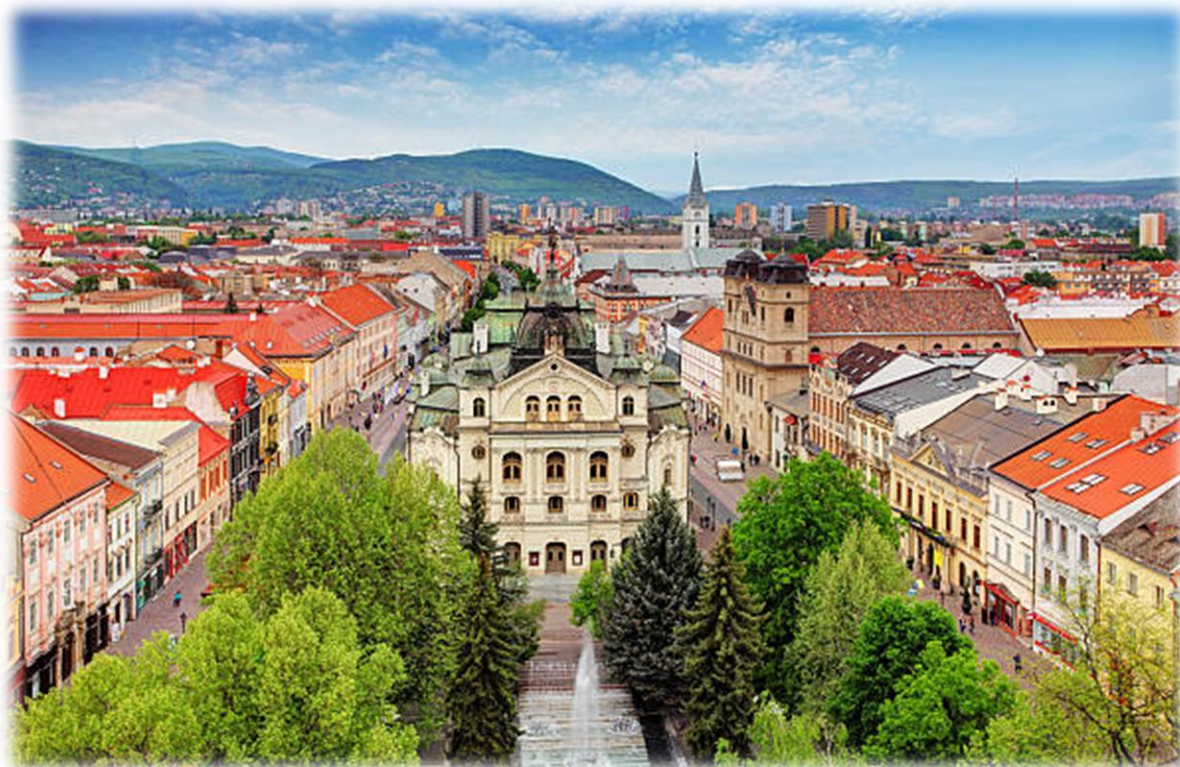
Pogled na čudovite Košice, drugo največje mesto na Slovaškem

Maja 2024 sva se v okviru Erasmus+ akreditacije za en teden odpravili na Slovaško. Na osnovni šoli Zakladna škola v Košicah sva spremljali pouk na razredni stopnji, implementacijo IKT tehnologije pri pouku in na kakšen način skrbijo za trajnostni razvoj.