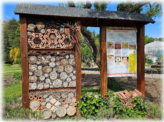
Hotel za žuželke v Botanic Garden

je eden najpomembnejših botaničnih vrtov v srednji Evropi. Ponuja ogled tropske in subtropske flore, arboretuma, znan pa je tudi po visokih rastlinjakih.