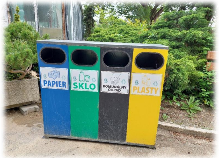
Ločevanje odpadkov v botaničnem vrtu