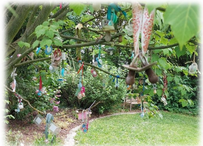
Drevo za dude